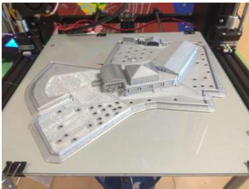
Modellino della Scuola Secondaria mappato dal drone con un'idea di modifica del cortile esterno

"Si è conclusa giovedì 15 luglio, l'attività prevista dal Progetto Lost in Summer, parte integrante del Progetto Lost in Education, che ha visto la partecipazione di studentesse e studenti della Scuola Secondaria di Primo Grado dell'Istituto Comprensivo di Su Planu.